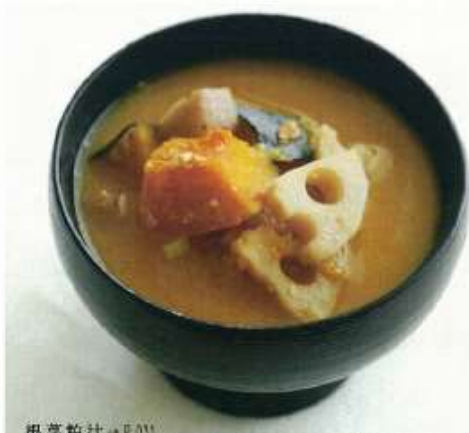
まずはおみそ汁とお吸い物