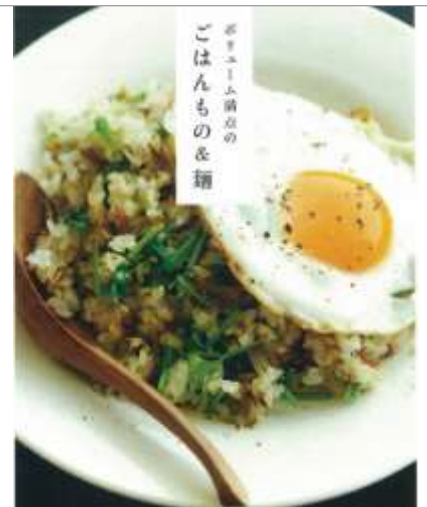
もっと！いりこ活用術

～掲載料理の一例～ いりことドライトマトのピラフ きのこといりこのマリネ そら豆のポタージュ